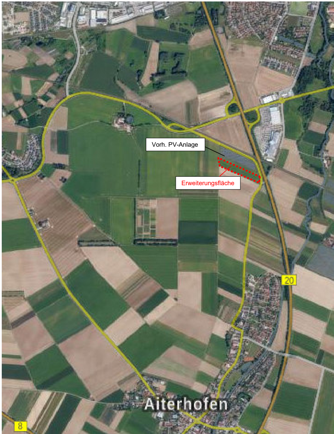
Abbildung 2: Luftbildausschnitt aus dem BayernAtlas vom 24.03.2022 – ohne Maßstab