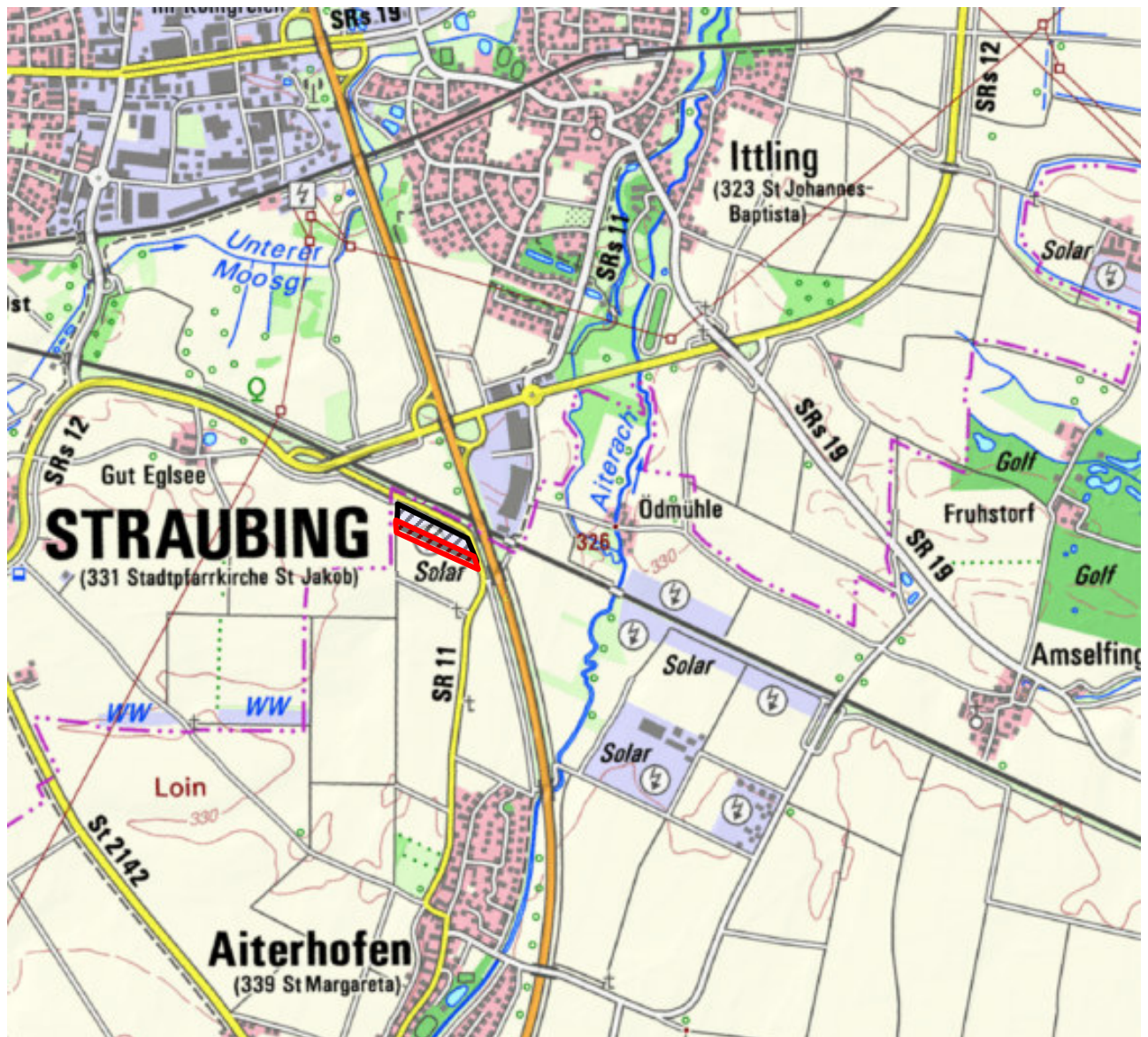
Abbildung 1: Übersichtslageplan aus dem BayernAtlas vom 24.03.2022 - Maßstab ca. 1:25.000